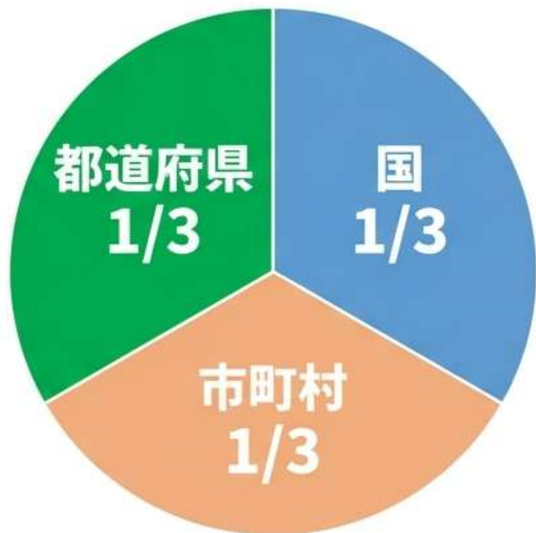
通常ルール of 負担