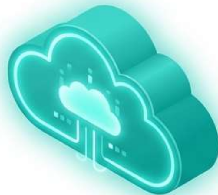
新システム（国保中央会運用）